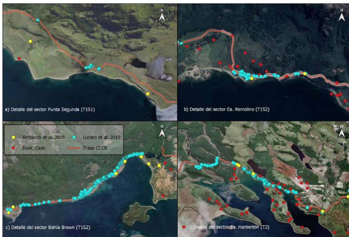
Figura 3. Relevamientos Proyecto Corredor Costero Canal Beagle.

Todas estas actividades permitieron identificar 7 áreas de alta sensibilidad arqueológica en los diferentes frentes de obra en sectores que no habían sido observados en el análisis anterior (Lucero et al. 2019a, 2019b, 2019c, 2019d). Esta situación obligó a plantear modificaciones en el trabajo planificado (Lucero et al. 2019e) que implicaron plantear dos tipos de acciones: a) medidas de salvaguardia y bloqueo preventivo de áreas (para aquellos casos en los que se podía proteger a los bienes patrimoniales puestos en peligro por la obra sin necesidad de intervenirlos) y, b) medidas de rescate y mitigación de daños, en los casos en que el patrimonio cultural fuese afectado por el avance de la obra (Lucero et al. 2019d, 2019e). Debido a los intereses en pugna estas modificaciones provocaron tensiones entre múltiples actores e interlocutores (funcionarios, arqueólogos, empleados de la obra, etc.). Como resultado de los nuevos relevamientos se detectó la presencia de un 4000% (Figura 3) más de sitios que los informados en la línea de base, con el consecuente aporte al acervo del patrimonio cultural provincial (Lucero et al.