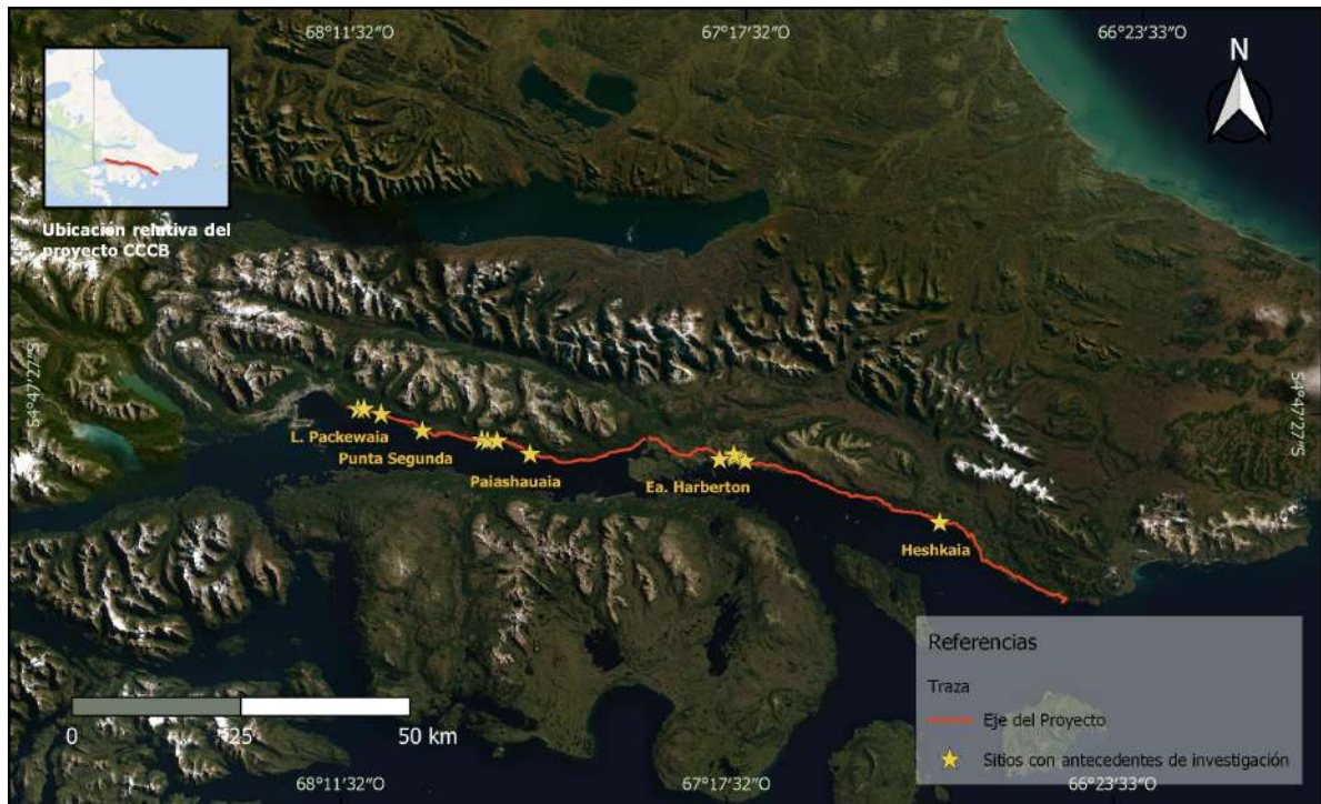
Figura 2. Ubicación del Corredor Costero.

se opusieron a su desarrollo por distintas razones 1 . Se realizaron audiencias públicas en el marco del procedimiento de Impacto Ambiental de la provincia, sin embargo la línea de base arqueológica fue presentada posteriormente cuando el diseño de la ruta ya estaba definido y restaba comenzar con la etapa de construcción.